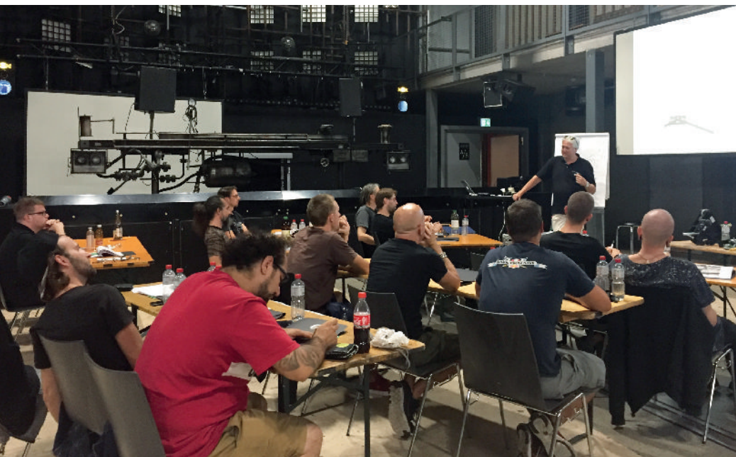
In-House-Seminar in Zürich.

beitern und erweiterte Kompetenzen im Arbeits- und Gesundheitsschutz sind explizit nicht Gegenstand dieser Fortbildung. An dem Curriculum arbeiten wir