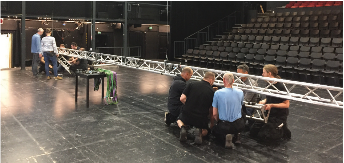
In-House-Seminar im Theater.

jeweilige Fortbildungsordnung. Für den Bachelor Professional bzw. Meister für Veranstaltungstechnik liegt diese vor. Für den Berufsspezialisten bisher noch nicht. Hier wird aller Voraussicht nach, die Branche vorangehen. Die igww hat bereits damit begonnen, einen Prozess zu starten, der Vorschläge für Spezialisten auf den Weg bringen soll. Genau an dieser Stelle setzen wir nun auch als Bühnenwerk an und entwickeln Angebote.