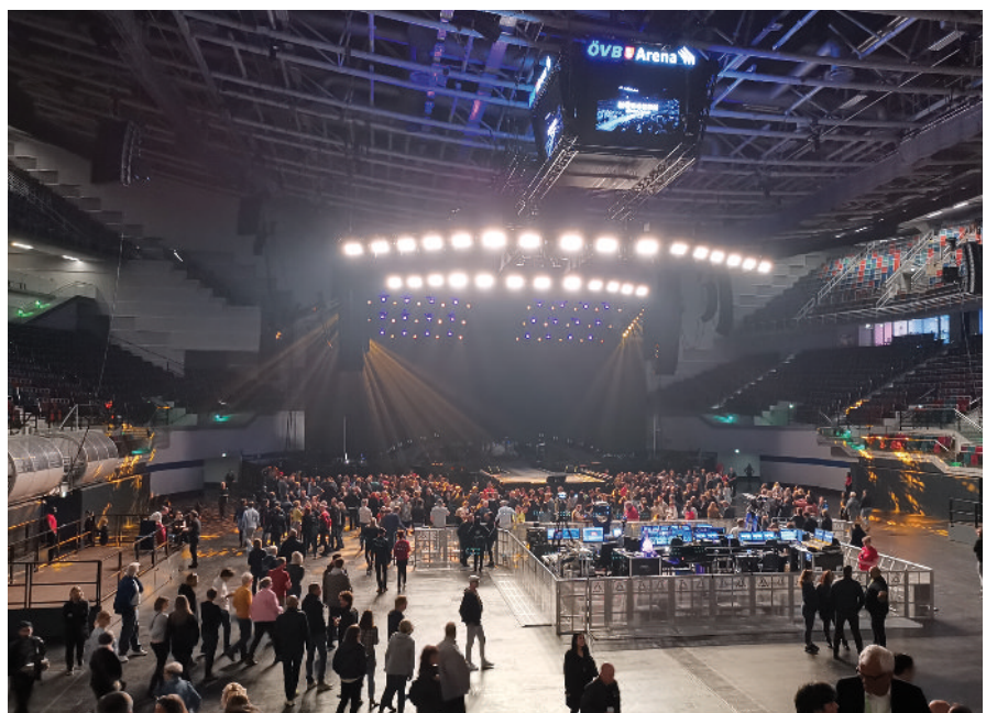
Vorpremiere der Udo Lindenberg-Tour 2019 in der ÖVB Arena.

Kaufmännische Aspekte, Projektmanagement, Führung von Mitar-