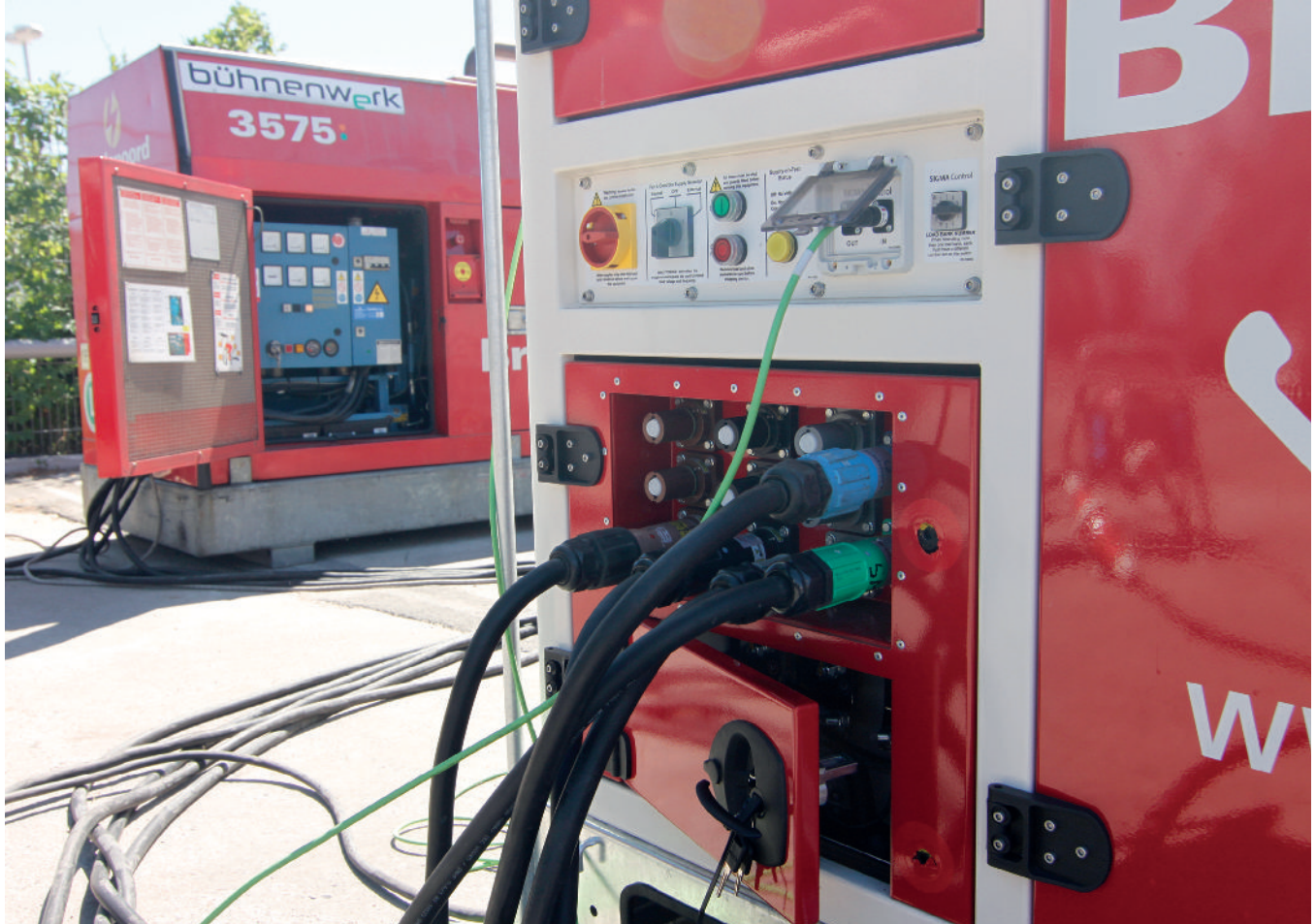
Elektrofachkraft, mobile Stromerzeuger.