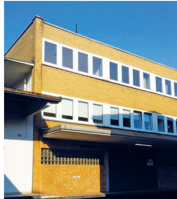
In einem unscheinbaren Hamburger Gewerbehof liegt die bühnenwerk GmbH

Die Video-Übertragung vom Seminarraum klappte hervorragend und ich konnte auf dem Bildschirm den Dozenten sowie einen Ausschnitt des Unterrichtsraums sehen. Auch das Whiteboard war gut zu erkennen. Auf dem Programm stand die Dimensionierung von Anschlagmitteln. Da ich mich mit dieser Materie bisher kaum befasst hatte, dem Unterricht aber gern aufmerksam folgen wollte, dauerte es nicht lange, bis die ersten Fragen auftauchten. Also Webcam- und Mikro-Button gedrückt. Ich stellte meine Frage und es kam – erst einmal nichts. An das Delay der Übertragungsstrecke – bedingt durch Latenzen und die Reaktionszeit des Referenten – musste ich mich erst gewöhnen. Aber nach einer Weile konnte man fast vergessen, dass man nicht live mit im Unterrichtsraum sitzt. Die Video-Übertragung sowie die Kommunikation der Online-Studenten untereinander wird durch Adobe Connect gewährleistet und läuft sehr professionell ab. Das Web-basierte Kommunikationssystem wurde an die spe-