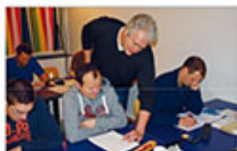
bühnenwerk: Meisterhaftes E-Learning in Hamburg

+++ Die aktuellsten Produkte der Veranstaltungsbranche im Detail +++