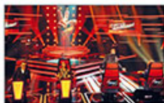
The Voice of Switzerland: Lichttechnik im Alpenland