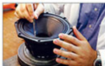
FaisalPRO: Der Lautsprecher- Hersteller im Porträt